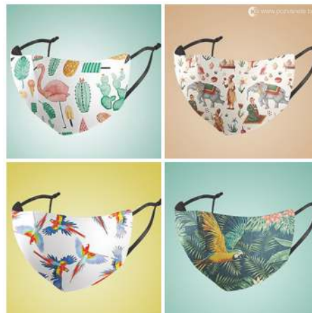
За всеки ден

Във Фейсбук се натъкнах на ето това предложение за индивидуална защита. Надявам се, авторът го е посочил за майтап иначе не се сещам за какво биха послужили два меча затъкнати в пояса?