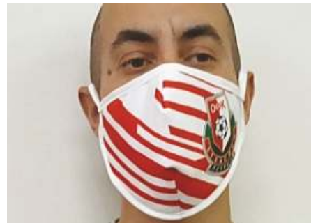
ФК Беласица - Петрич пусна предпазни маски