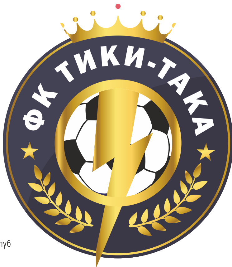
Емблема на футболен клуб в аматьорската лига